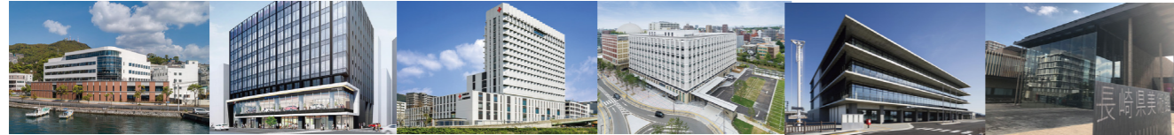
重工記念長崎病院